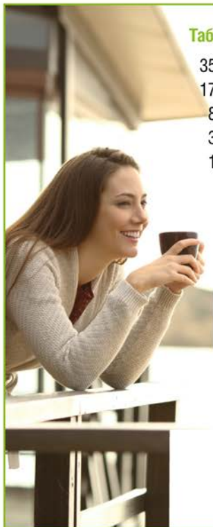
Таблиця 1: Оборот у.о. – % Рівень / Титул

КРОК #1. ПОТРІБНА МРІЯ, ЦІЛЬ! Це той «маяк», до якого прямуватиме Ваш бізнес-корабель. Уявіть її, як уже здійснену. Запам'ятайте цю картинку і свої відчуття. Обов'язково «заякоріть» свою мрію/ціль: нехай це буде щось, що приносить Вам задоволення, що постійно з Вами (прикраса, фото, тощо).